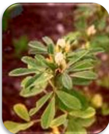
Urten Bukkehornskløver (Trigonella foenum-graecum), planten til venstre og de næringsrike frøene fra planten til høyre.

Det er fordelaktig å massere hodebunnen et par minutter hver dag!